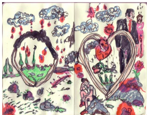
Philippe Perrot , Sans-titre , 2010 Crayon aquarelable et éosine sur carnet Moleskine