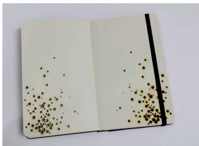
Vincent Mauger Sans titre , 2010 Carnet de croquis Moleskine perforé et brûlé, 13 x 21 cm