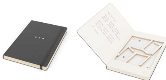
Wa.de.be designers 3 petites boules , 2010, Technique mixte sur carnet de croquis Moleskine, 13 x 21 cm