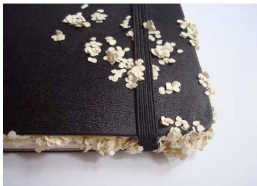
Ivana Brenner , Sans titre (détail) , 2010 Carnet Moleskine et technique mixte, 13 x 21 cm