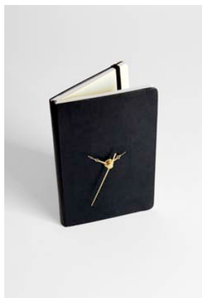
Katrin Sonnleitner Tic-tac-book , 2010