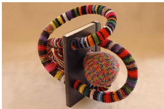
Joana Vasconcelos , Moleskina Contamina , 2010 Moleskine sketchbook, handmade knitting and crochet, polyester, polyurethane