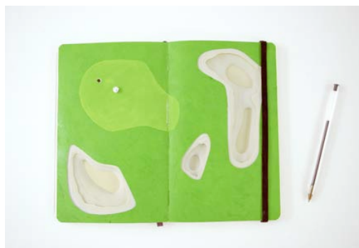
Mathieu Lehanneur , Tiny Golf , 2010 Gouache, papier, Moleskine © Photo : Mathieu Lehanneur