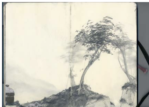
Guillaume Bresson , Sans titre , 2010 Crayon et collage sur carnet de croquis Moleskine, 13 x 21 cm