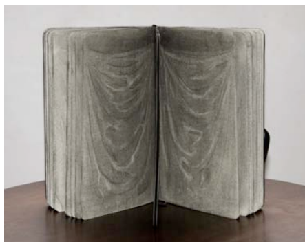
Guillaume Pinard , Rideau I , 2010 Fusain sur carnet Moleskine