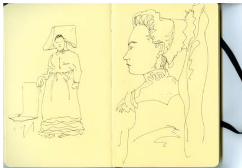
Stéphane Calais , Sans titre , 2010 Carnet Moleskine et technique mixte, 13 x 21 cm