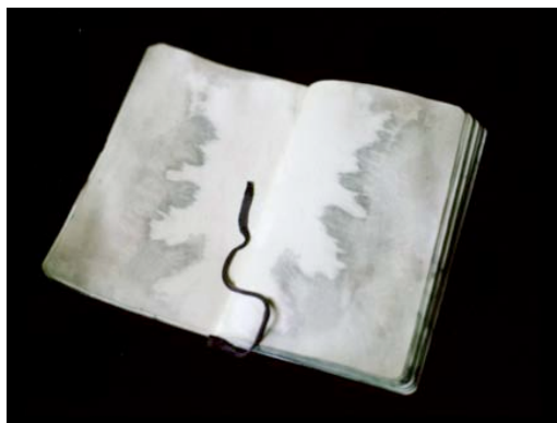
Estelle Hanania , The tide , 2010 Encre de chine sur carnet Moleskine